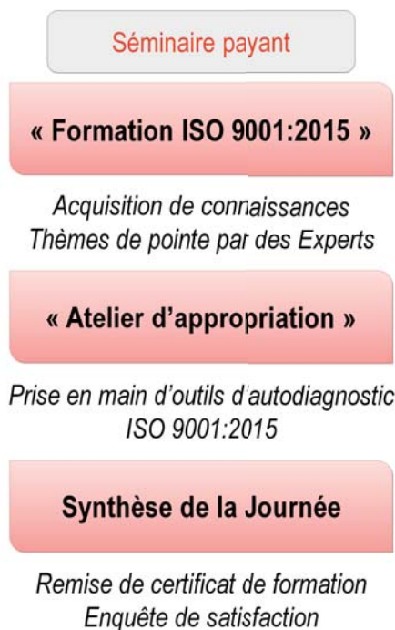
Figure 2 : Programme du séminaire AGORA 2015 [3]

Pour 2015 le séminaire a ainsi proposé des ateliers sur un tout nouvel outil d'autodiagnostic élaboré sur l'ISO/DIS 9001:2015, qui a remporté un franc succès auprès des participants.